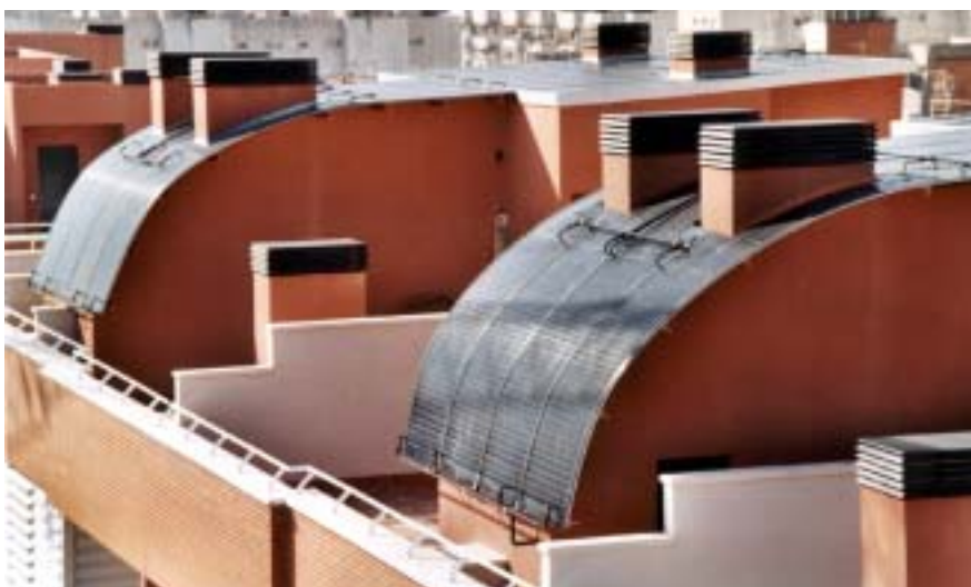
Exemple de toitures solaires intégrées (Energie Solaire SA à Barcelone pour la production thermique).

Autre grand point fort de Granit, la conception de produits intégrant plusieurs technologies dans une application. De cette façon, on peut augmenter le rendement du système en exploitant toutes les synergies technologiques et logistiques potentielles, ce qui optimise aussi sa fonction environnementale (par exemple un système combiné peut inclure plusieurs étapes de traitement :