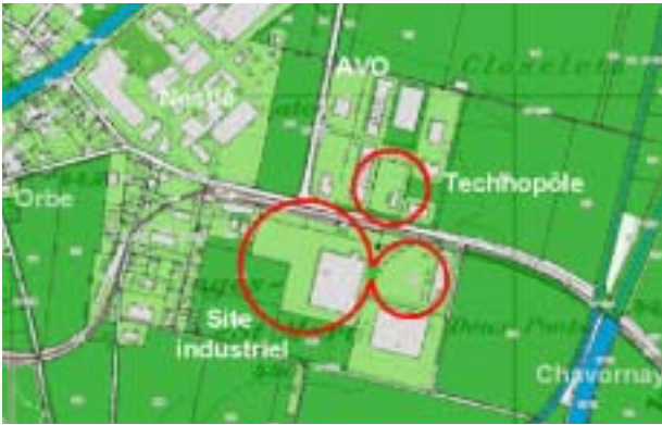
Deux sites – technopôle et site industriel pilote – en parfaite synergie.

plusieurs centrales de production de chaleur et d'électricité telles que CRICAD à Crissier, illustrent cette réalité. Cependant, dans notre pays, on ne valorise à l'heure actuelle qu'environ 11% du potentiel total des résidus de biomasse (déchets des PME et des ménages, déchets d'exploitations forestières, champêtres et agricoles, déchets d'exploitation du bois, etc.).