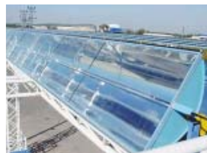
Exemple de panneaux solaires Solel à concentration pour la production thermo-électrique.

source. Plusieurs technologies développées pour produire de l'énergie par le soleil et par la biomasse existent depuis plus d'une décennie et ont déjà fait leurs preuves : elles sont fiables et rentables. L'exemple de la